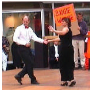
Boogie på Gyllentorget

Ett trettiotal dansare har också under året provat på Boogie-Woogie på de helgkurser vi haft. På Boogie &