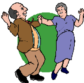
"Efter julskinkan och ..."

Strepplers har jag inte dansat till på över 10 år, men de har en trogen publik och det märks på dansglädjen bland både veteraner och nybörjare. De spelar många "goa foxtrotmelodier" och man blir lite nostalgisk. Det bästa med dansen är att man aldrig blir för gammal, det är aldrig för sent att